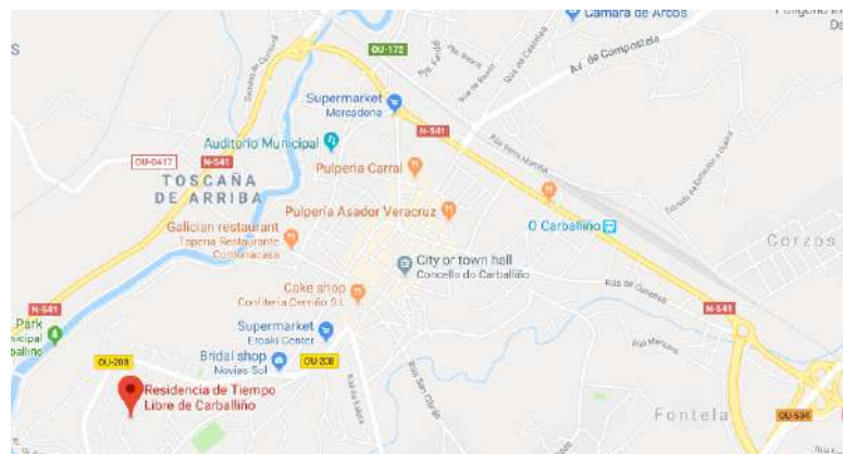
O Carballiño fica a 28 km ao noroeste de Ourense